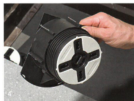
Schéma pokládky podložek

Podrobnosti o instalaci a používání výškově stavitelných podložek